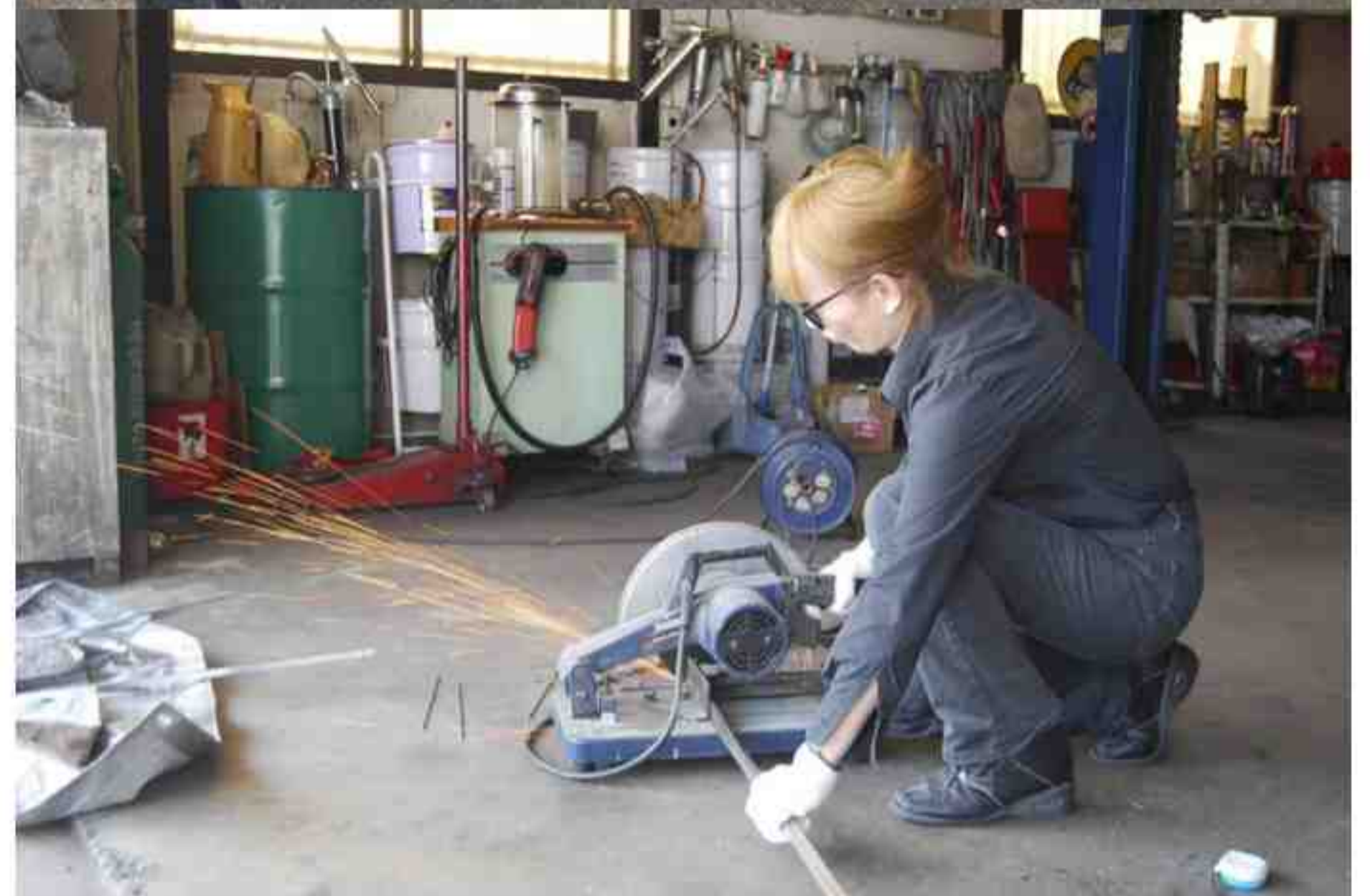
□COZY INTERNATIONAL LTD.