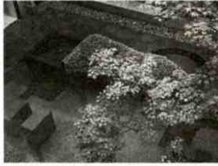
舞台となる「千草ホテル」の中庭

千草ホテルで、アート・ホスピタリティをテーマに新進気鋭のアーティストが年に4人ずつ展示するプロジェクトが始まります。第1弾は、北九州を中心に活躍している美術家・