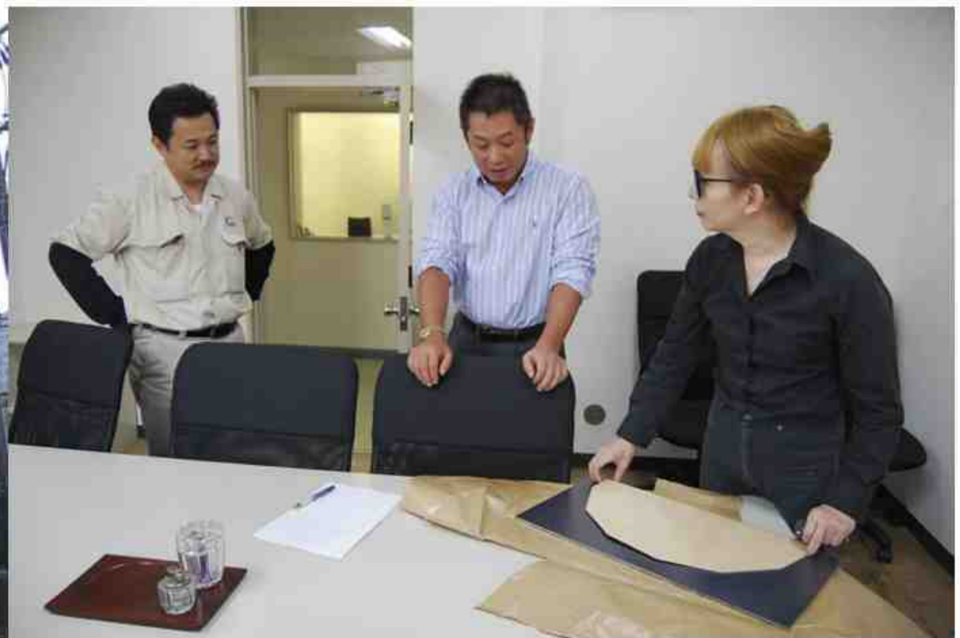
□コイルセンター国光株式会社