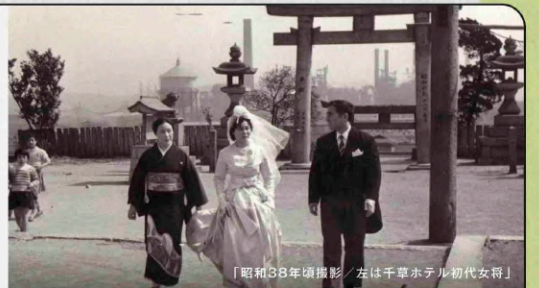
「昭和38年頃撮影 / 左は千草ホテル初代女将」

戦後間もなく千草ホテルが現在地に移転してからは、豊山八幡神社で結婚式を挙げられた多くの方々が当ホテルで披露宴を行われ、幸せなご家庭を築いてこられました。