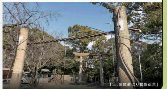
「上、同位置より撮影近景」